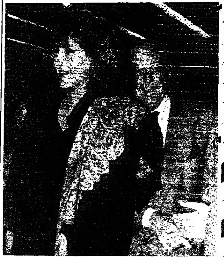
الندريس باباندريو رئيس وزراء اليونان، مع صديقه ميميترا لينا في لحظة اخذت لهما اثناء انعقاد مؤتمر قمة المجموعة الأوروبية في جزيرة رودس في اوائل كانون الاول ١٩٨٨. باباندريو صرح مؤخرا بأنه سيقدم دعوى قضائية ضد مجلة تايم، بسبب التحريض بشخصه.